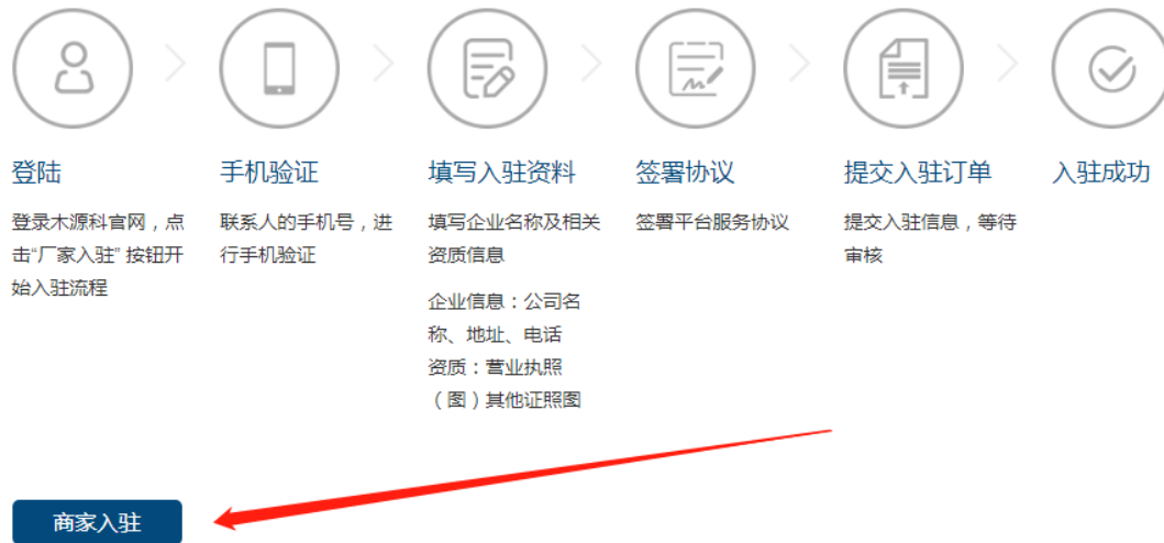
图 5-1-2 红木家具企业申请入驻页面

也可以在点击“商家后台”，在这个界面的注册信息里面根据页面提示逐步完成入驻手续。