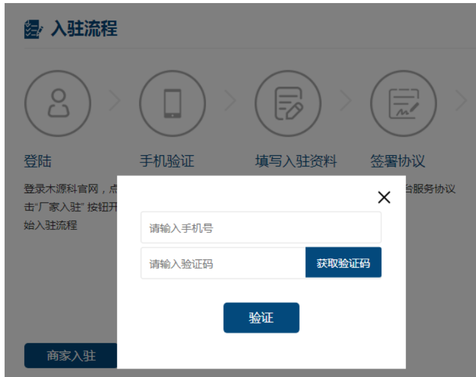
图 5-2 手机验证页面