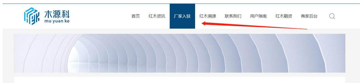
图 5-1-1 木源科官网厂家入驻入口

打开木源科官网（www.mu Yuanke.com/）首页，点击“厂家入驻”按钮，进入到“商家申请入驻”界面。