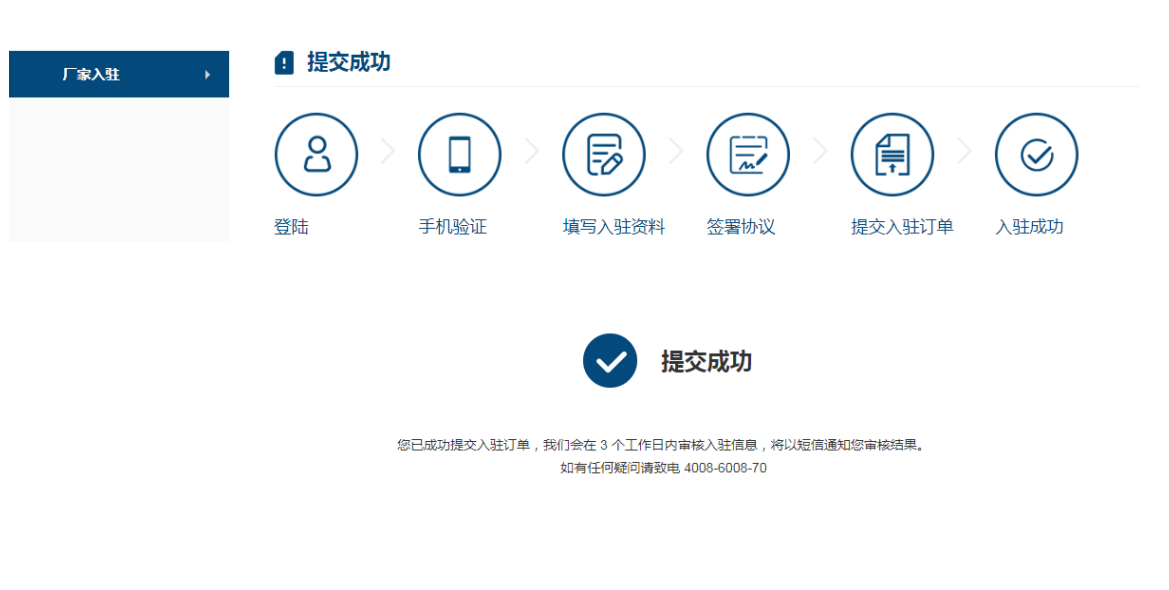
图 5-5 等待审核页面

【成功提交订单，等待审核】 您提交的入驻信息都需要经过木源科平台审核，时间是 3 个工作日，审核完成，审核结果会以短信形式发送到贵企业的注册手机上。