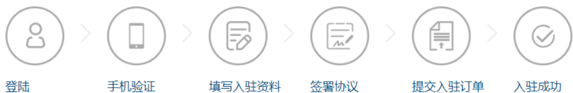
图 4 入驻流程图